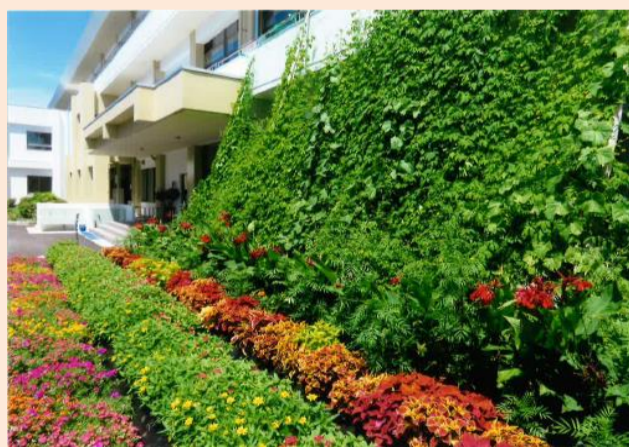
令和5年度 最優秀賞 国東小学校 様