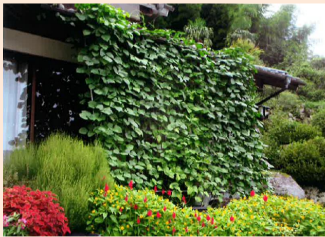
令和5年度 家庭部門賞 財前 寿文 様