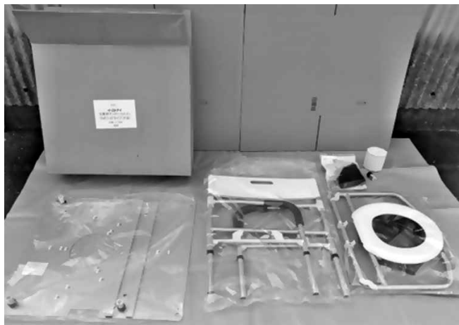
災害マンホールトイレの部品