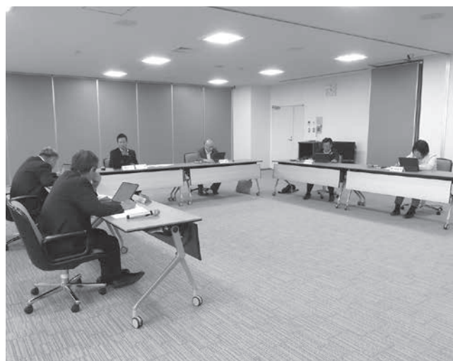
産業建設常任委員会及び分科会の審査

まず、分科会で令和6年度一般会計補正予算の関連部分について審査を行い、次に委員会に付託された議案1件、発議1件について審査しました。発議第4号「2024年度大分県最低賃金の改正等に関する意見書(案)」については、中小企業・小規模事業者や地域の実情に即していないとの意見から、修正案が提出され、修正案及び修正箇所を除いた部分の原案について、全会一致で可決すべきものと決しました。