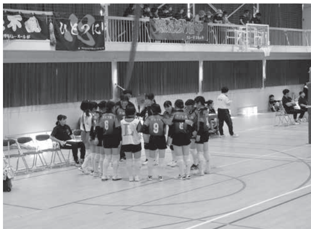
郡市中学校総合体育大会