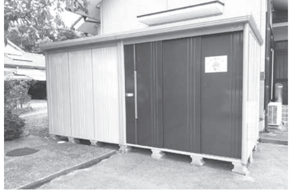
コミュニティ事業で購入した防災備蓄倉庫

以上議案4件については、採決にあたり討論はなく、全員異議なく原案のとおり可決すべきものと決しました。