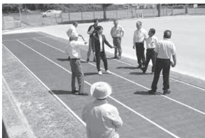
陸上競技場タータン