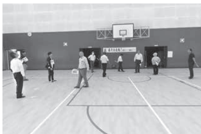
B&G国見海洋センター

なお、14時30分から文教厚生常任委員会及び分科会を開催。付託された議案38号補正予算の関連部分の審査を行いました。また、発議第3号「ゆたかな学びの実現と教職員定数の改善及び義務教育費国庫負担制度拡充に係る意見書(案)」の審査を行い、原案のとおり可決すべきものと決しました。