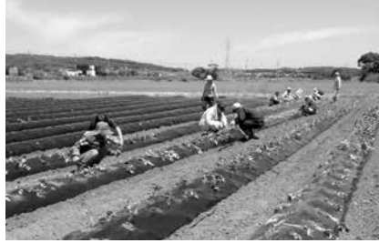
甘藷の植え付け作業

玉ねぎについては、共同出資型の双日大分農人株式会社設立され、機械化が可能な加工用玉ねぎの拡大に向けた機械導入支援に取り組んでいます。