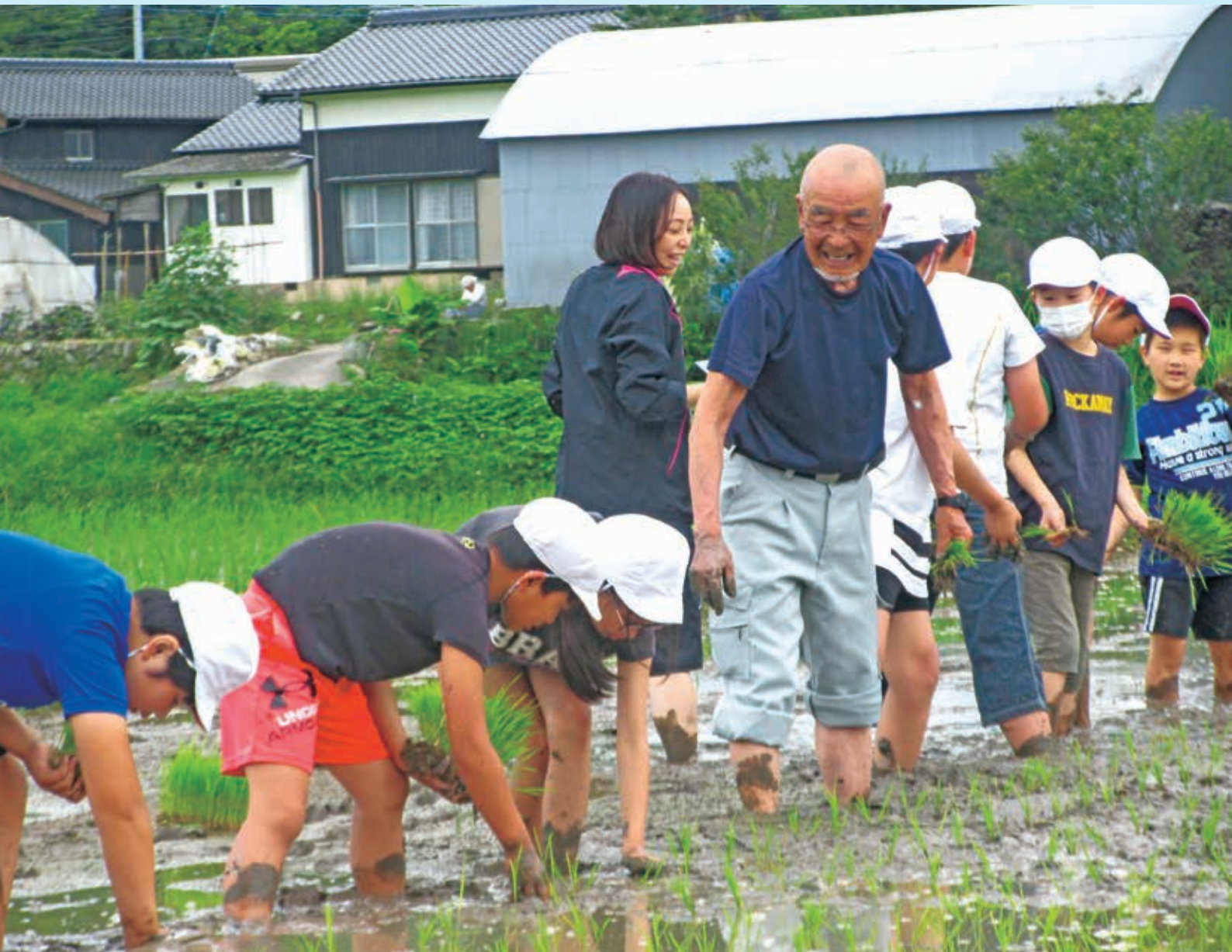
表紙の写真：志成学園5年生の田植え体験学習