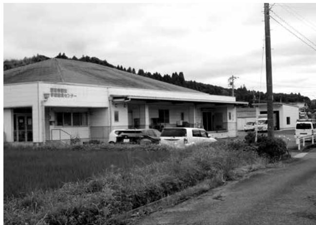
食物アレルギー対策に取り組む給食センター

国東市においては、現在、25人の児童生徒が食物アレルギーの申請をおこなっています。