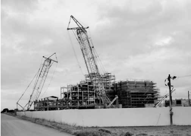
建設中の広域ゴミ処理施設