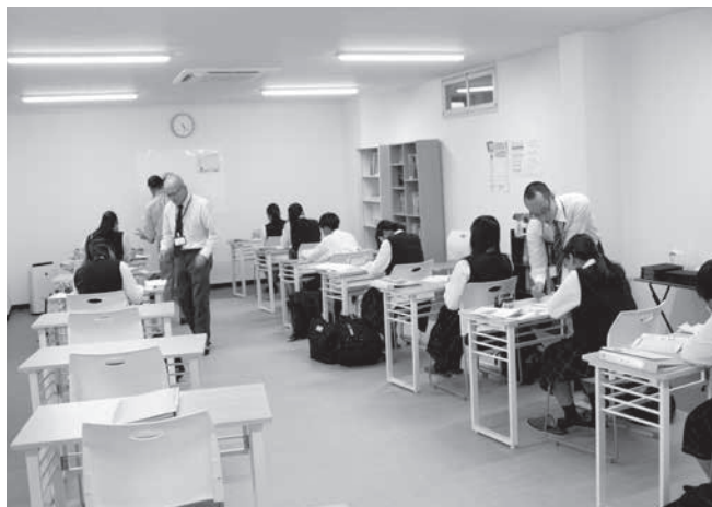
夢道塾の授業風景

令和5年度は、41人のうち国公立大学進学者が17人、私立大学進学者が7人となっています。