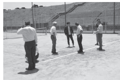
安岐オムニテニスコート