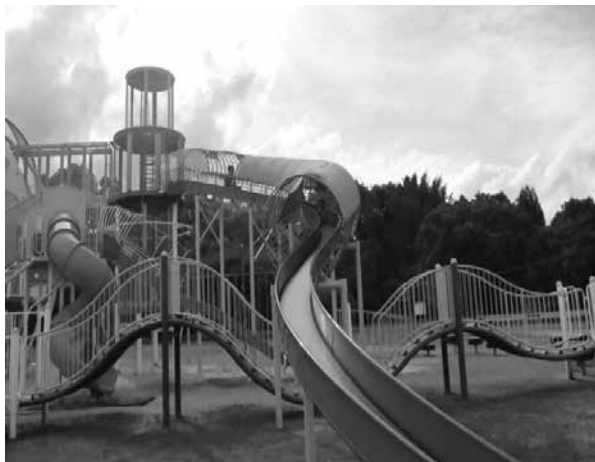
市内外からたくさんの方が訪れる公園の整備を

子育て世代から壮年層まで、いろいろな年代の方が楽しめる様々な要望をいただいています。現時点で具体的な事業費や予算規模を、お示しできる段階ではありません。