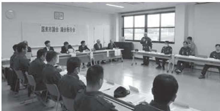
前回の議会報告会の様子

なお、開催時期は12月議会前の10月から11月を予定していますが、詳細は決定次第ホームページ等でお知らせいたします。