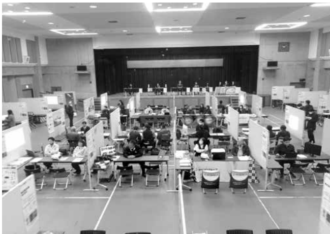
就職説明会の様子