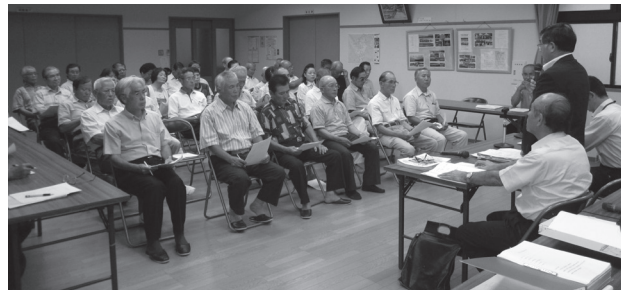
9月に行われた朝来地区の懇談会

国東市では、市民の皆さんと市長が直接話し合い、広くご意見やご提案などをいただき、市民と行政による住みよい豊かなまちづくり、地域づくりを進める目的で、市内16会場（地区公民館ごと）で「市政懇談会」を開催しています。皆さんのご参加をお待ちしています。