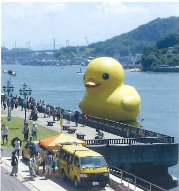
※別会場での様子です

「世界にボーダーラインは無い。」という作品コンセプトのもと、オランダ人アーティストのフロレンティン・ホフマン氏により2007年に制作されたパブリックアートを九州初展示。年齢や人種など、異なった背景を持つ全ての人々に癒やしを与えます。期間中は限定グッズの販売も。