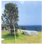
見えないベンチ・念願の木/オノ・ヨーコ

※内容が変更になる可能性がございます。最新の情報は特設サイトをご確認ください。 https://kunisakiart.jp/