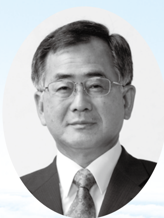
国東市長 三河 明史