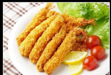
サクッとプリッと海老フライ 大群20尾(約0.7kg)