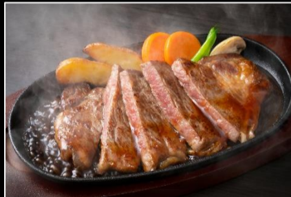
おおいた和牛サーロインステーキ (200g×2枚)

賞品は国東味自慢の厳選10品! (各品を2名様に/計20名に贈呈) ※画像はイメージです