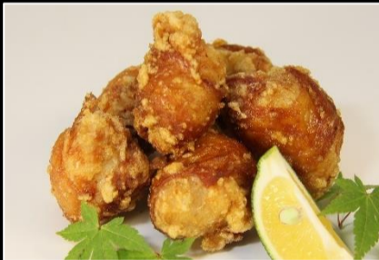
からあげ花ちゃん/骨なし唐揚げ 1.5kg(500g×3パック)