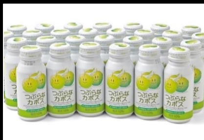
みんな大好き! つぶらなカ波斯 (30本×1ケース)