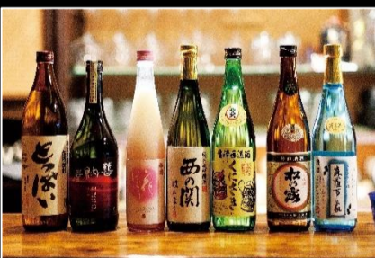
国東の地酒3本セット(西の関純米酒、 森羅万象を各720ml、とっばい900ml)