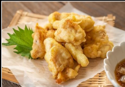
おおいた名物とり天 2kg(500g×4パック)