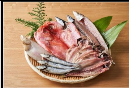
磯武の竹炭仕込み干物詰合せ 大漁2.3kg(魚種4種以上)