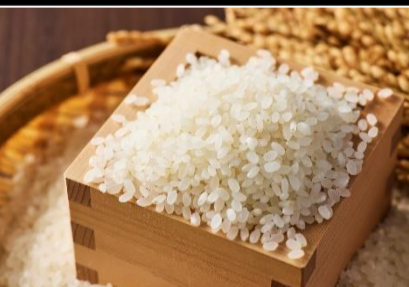
国東産の美味しいお米 つや姫5kg(5kg×1袋)