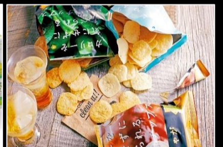
揚げないポテチ! 焼きじゃが12袋 (うす塩、コンソメ味など4種を各3袋)