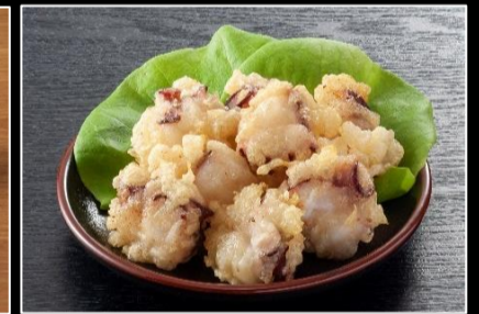
たこ&ふぐの唐揚げセット (たこ唐300g、ふぐ唐500g)