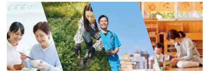
多くの支援制度で、安心して移住できる国東市

8月14日(金)にUターン相談会を開催します。 各種支援制度の詳細を一度に聞ける機会となっております。ぜひご来場ください。