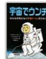
課題図書 小学校中学年の部

オノガワアサコ/作・絵 フレーベル館/出版 てんぐさまの鼻にできたおできを、こてんぐたちが秘密で治そうと大奮闘!!