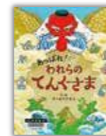
指定図書 小学校低学年の部

九州・山口各県図書館協議会において選定された書籍で、小学校から中学校まであります。