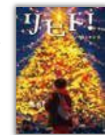
課題図書 小学校高学年の部

A・ボンドー=ストーン/作 あすなろ書房/出版 宇宙飛行士のトイレ事情や宇宙での排せつの秘密がわかります。