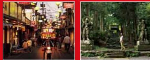
豊後高田市「昭和の町」 国東市「両子寺」

豊後高田市・国東市が指定する観光施設を 巡っていただくとレンタカー料金(基本料金(税込))の なんと半額(※上限3,000円)をキャッシュバック さらに、指定宿泊施設に宿泊した場合には、 2,000円を加算してキャッシュバック