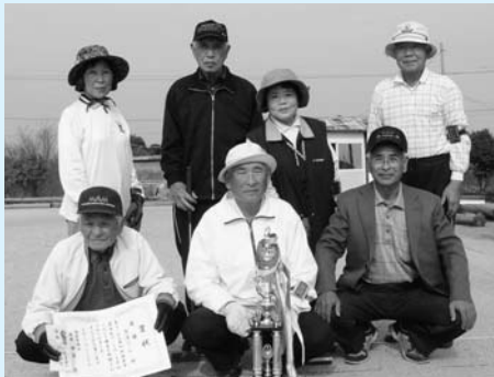
優勝した重藤チーム

去る平成21年10月30日、第4回議長杯ゲートボール大会が市議会議員チームも参加し盛大に開催されました。