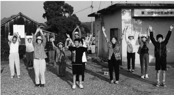
来浦中村地区でのラジオ体操