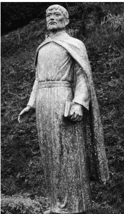
ペトロカスイ岐部

ら進めていきたいと思ひます。先覚者が旧町の歴史にも、町史にも掲載されておりますので、資料収集はできると思ひます。広く市民に知っていたくためにも広報誌の活用や冊子として各図書館に置くなどの利用が考えられていますけれども、先ほど言われましたように先覚者をどの範囲にするかということで、選定委員会等を設置していかないといけないと思われまので今後検討していきたいと思ひます。