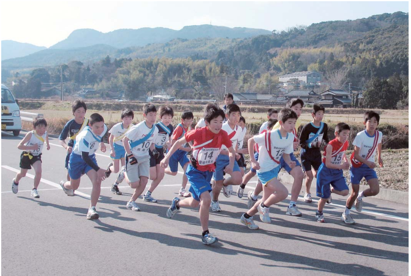
第4回 国東市駅伝競走大会