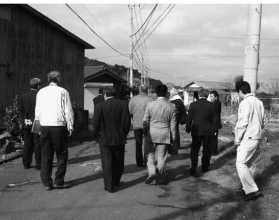
来浦浜陽地区の市道

全般的に言えることだが、市道の傷んでいる所が多く見受けられる。緊急度の高いところから計画的に整備を進め、市民の通行に支障を来たさないよう努めてほしいとの意見がありました。