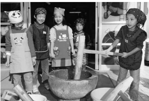
安岐保育所のもちつき

福祉事務所長 市報、またはホームページ、来年4月から始まるケーブルテレビ等を活用したいと考えています。