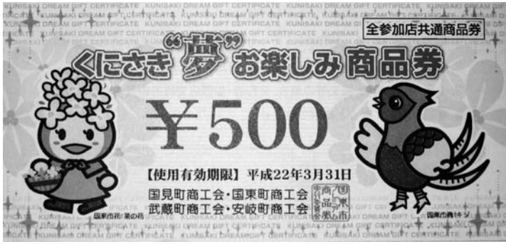
統一プレミアム商品券