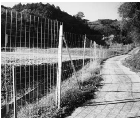
岐部地区のイノシシ防護金網柵

産業商工部長 農作物被害は2,030万円で、本年度は経済対策を利用して電気柵は2.8倍の7,100m、金網柵は10倍の4万250m実施しました。今後は中山間地域総合整備事業等を活用して対策に努めたいと考えています。