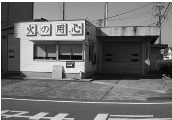
消防署武蔵出張所

市長 現在、消防署の建て替え、本署や安岐・武蔵出張所の老朽化が進んでおりますので、そういう問題を加味しながら、検討しているところでありますが、来年、こちらの考えがまとまりましたら、全員協議会等に報告したいと思