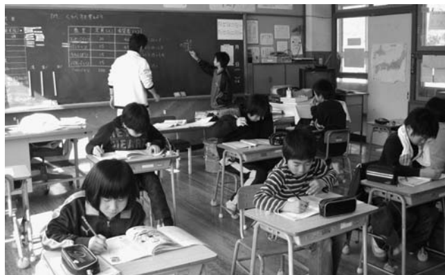
大恩小学校の4年生と5年生の授業のようす