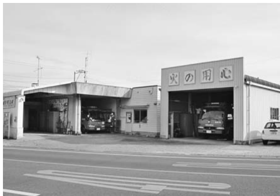
消防署安岐出張所