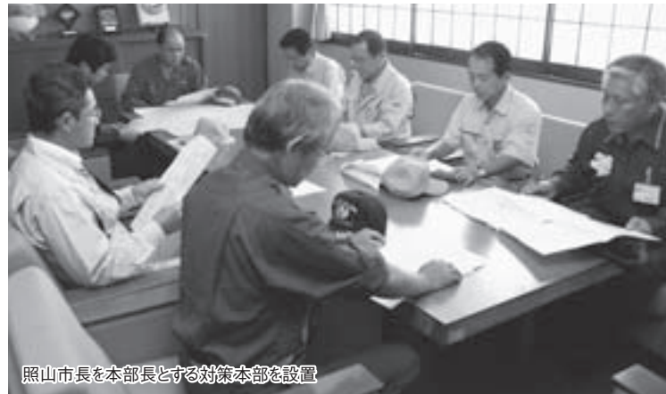
照山市長を本部長とする対策本部を設置