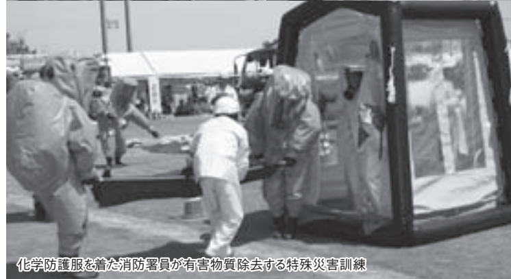
化学防護服を着た消防署員が有害物質除去する特殊災害訓練