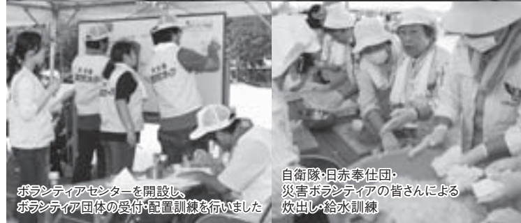
ボランティアセンターを開設し、 ボランティア団体の受付・配置訓練を行いました