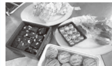
▲手作りお菓子に参加男性はメロメロ