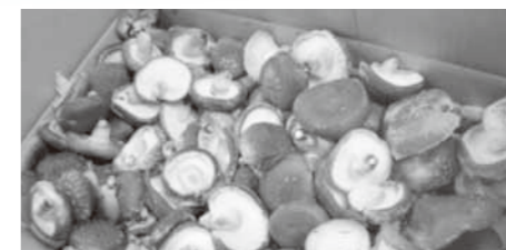
▲肉厚の生椎茸は、めちゃくちゃ美味しかったです!

問い合わせ くにさき婚活応援団事務局 (政策企画課内) ☎0978-72-5161