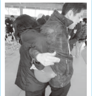
背中合わせで風船割りゲーム! (男女で初めての共同作業)

イベント終盤のカップリング調査では、なんと10組のカップルが誕生！国東の原木椎茸の出汁のように“中身の濃い”恋活イベントとなりました。