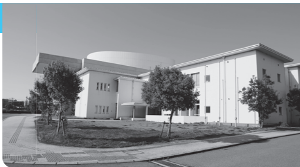
▲アストくにさきアグリホール

【おことわり】 アストくにさき及びケーブルテレビセンター周辺で、一部交通制限を行う場合があります。ご不便をおかけしますが、ご理解、ご協力をお願いします。