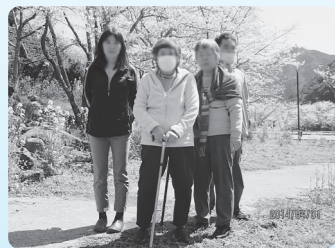
安岐ダムで満開の桜の中を散策、とても綺麗でした

「生活介護」は、主に常時介護を必要とする方（病院を退院したばかりの方や、お仕事が難しい方など）を対象に、日常生活上の支援や、創作的活動、生産活動の機会の提供などを行い、生活能力の向上を図っています。また、散歩や、軽スポーツなどで、身体機能の向上も図っています。ゆっくりと一人ひとりのペースに合わせ、独自のプログラムを進め、楽しみながらQOL（生活の質）を高めていきます。