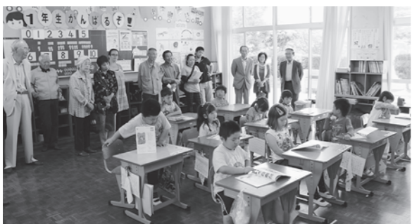
▲学校公開日参観授業（竹田津小学校）

市教育委員会は、従来の「協育ネットワーク事業（学校・家庭・地域が連携・協力して子どもに関わる教育を協働推進）」に加え、「目標協働達成モデル調査研究事業」をスタートしました。この事業は、学校・家庭・地域の三者が協働し、学校の重点目標を達成