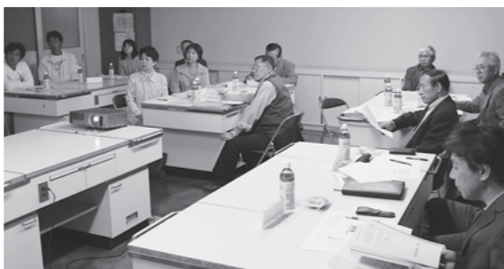
▲目標協働達成チーム会議（竹田津小学校）

点目標を達成しようとするもので、現在、竹田津小・富来小・国見中の3校がモデル校として実践的な取り組みを進めています。ある研究調査によると、「子どもの教育に係わる地域住民が多い地域ほど、学力が高い」ことが報告されています。竹田津小では、5月当初に三者の代表者（PTA・評議員・区長・老人クラブ・児童民生委員等）で構成したチーム会議を開催し、学校の重点目標「勉強に頑張る子の育成」の達成に向けて、家庭（毎週月曜日ノーテレビノーゲームに取り組むなど）や地域（学校公開日に毎回33名以上授業参観を行うなど）が取り組む具体的な内容が協議され、了承されました。5月末に実施された学校公開日では、45名もの方々が授業参観をされ、授業や児童の様子などについて多くの感想を頂きました。市教育委員会では、こうした取り組みを市内の全小中学校に広げ、「地域総ぐるみによる子育て」の機運を一層高め、児童生徒一人ひとりのよりよい確かな育ちを進めていきます。