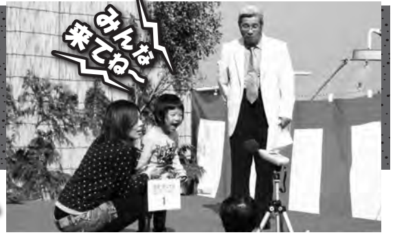
昨年の猪嚇し絶叫大会の様子

心もお腹もまんぷくになる、とっておきのイベントを紹介！今年で第6回になる両子谷まんぷく祭が10月19日の日曜日に開催される。前回よりさらにパワーアップしたまんぷく祭、早速プログラムの紹介をしよう！