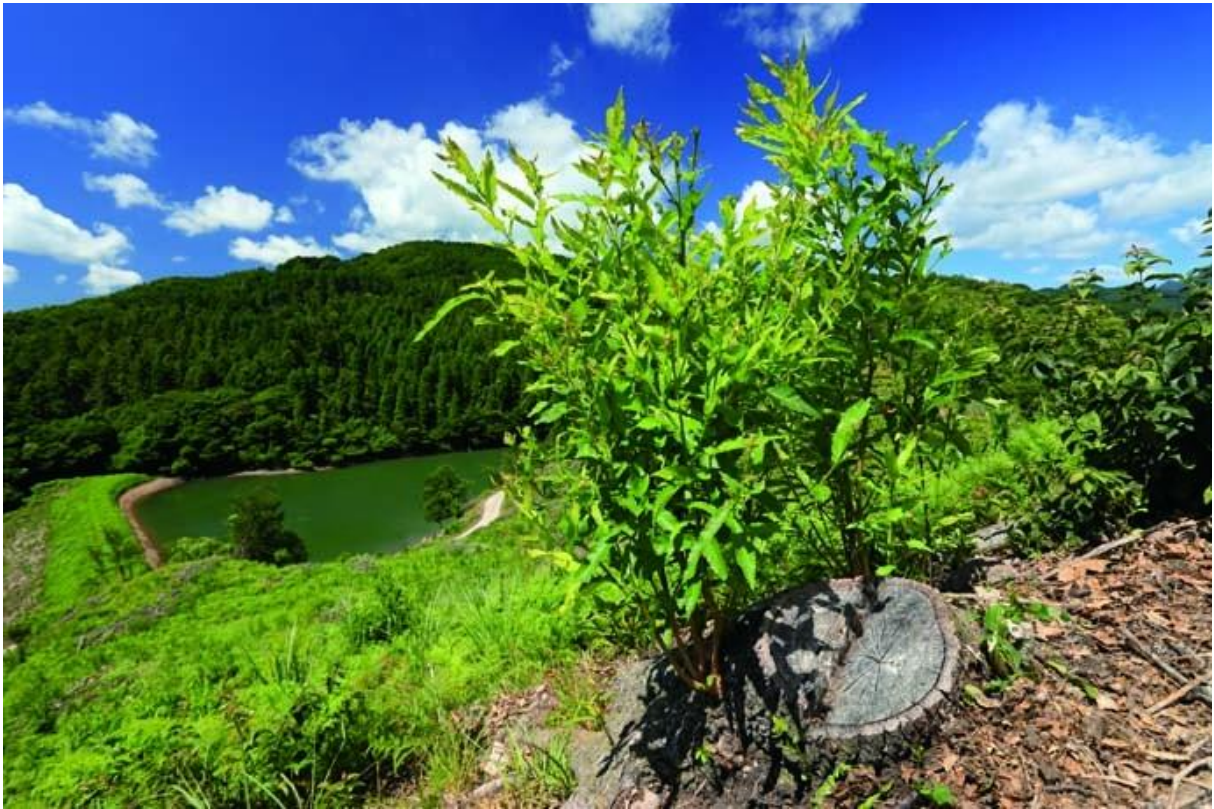
クヌギ林とため池（武蔵町松ヶ迫）