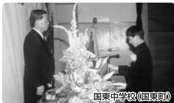
国東中学校(国東町)