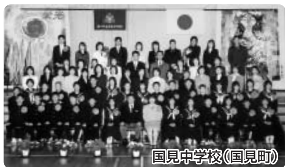
国見中学校(国見町)