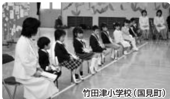
竹田津小学校(国見町)