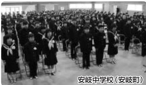
安岐中学校(安岐町)