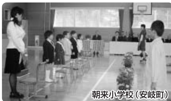
朝来小学校(安岐町)