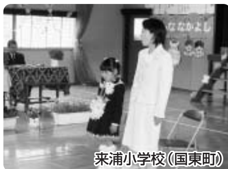
来浦小学校(国東町)