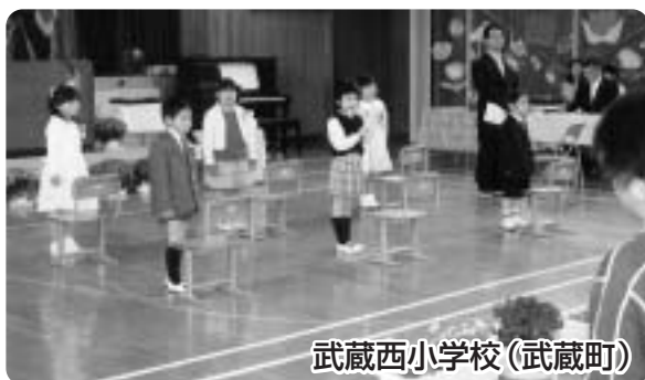
武蔵西小学校(武蔵町)