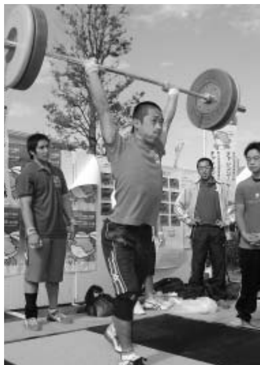
▲昨年のふるさと祭り(国東町)で行われたデモンストレーション

一人でも多くの市民の皆様の参加と協力を得ながら、全国から集う人々を温かく迎え、迎える市民も共に感動を分かち合える魅力ある大会とするために、市民の皆様のご理解とご協力をお願いします。