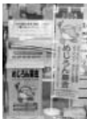
市役所本庁に設置された「メジロン募金」の募金箱

チャレンジ! おおいた国体・おおいた大会の募金箱を国東市役所本庁1階の総合窓口と、アストくにさき1階窓口に設置しています。募金は大会が開催される平成20年10月末まで受付、集まった募金は、訪れた全国の人々をおもてなしの心でお迎えする経費などに使わせていただき、大分らしい大会の実現をめざします。