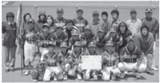
▲優勝した「富来タイガース」のみなさん ②「小原スポーツ少年団」 ③「伊美ジャガーズ」・「国東飯塚スポーツ少年団A」(参加14チーム)