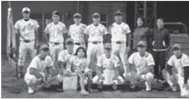
▲優勝した「オールスターズ」のみなさん ②「ウイング」③「イーグルス」「サンクス」(参加9チーム)