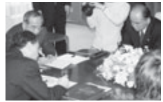
▲県庁で行われた調印式の様子

ソニーセミコンダクタ九州株式会社は、国東町小原の大分テクノロジーセンター（大分TEC）にデジタル機器向けの半導体パッケージの製造棟を増設することを表明し、4月27日(木)、県庁で増設協定調印式が行われました。