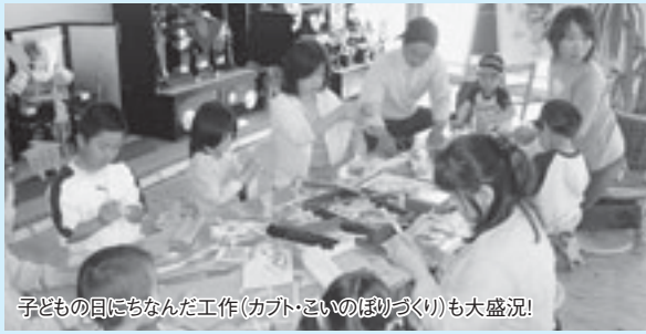
子どもの目にちなんだ工作(カブト・こいのぼりづくり)も大盛況!