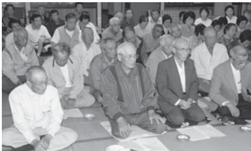
▲設立総会には組合員62名が出席