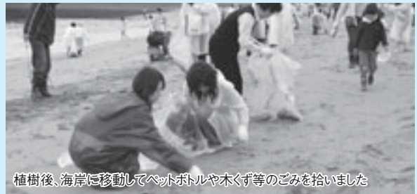
植樹後、海岸に移動してペットボトルや木くず等のごみを拾いました