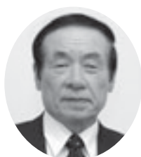
藤原雅章教育委員長