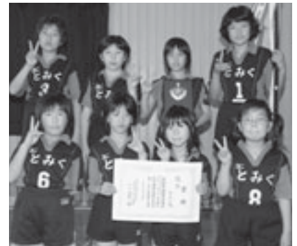
▲優勝した「とみく(国東)」のみなさん ②「安岐うめ(安岐)」 ③「飯塚少女(国東)」・「姫島少女(姫島村)」