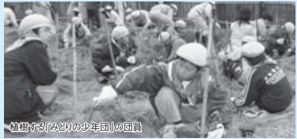
植樹する「みどりの少年団」の団員

失われつつある国東地域の伝統的な民俗行事に親しんでもらおうと、1歳前後の子どもを対象に行われた「弥生のムラから初誕生」では、「餅ふみ・餅かるい」「物えらび」「泣き相撲」が行われ、愛らしい子どもたちの姿に会場は終始和やかな雰囲気包まれていました。