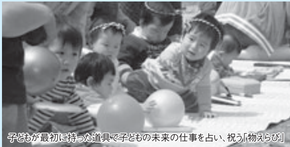
子どもが最初に持った道具で子どもの未来の仕事を占い、祝う「物えらび」