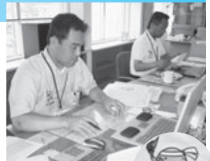
▲めじろん(大分国体マスコットキャラクター)シャツで業務を行う国体推進室の職員