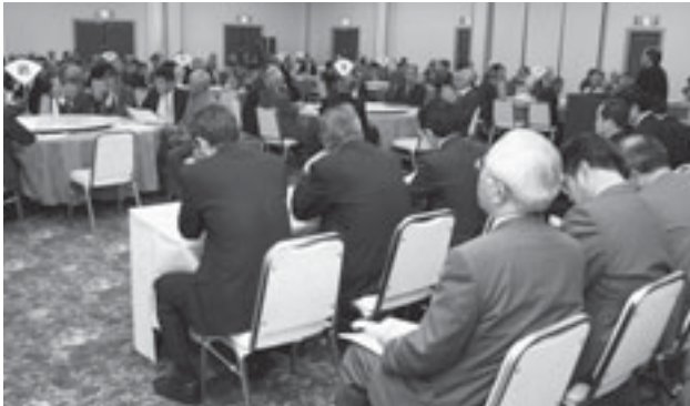
▲区長会のような様子