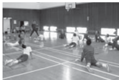
▲入念な準備体操でウォーミングアップ