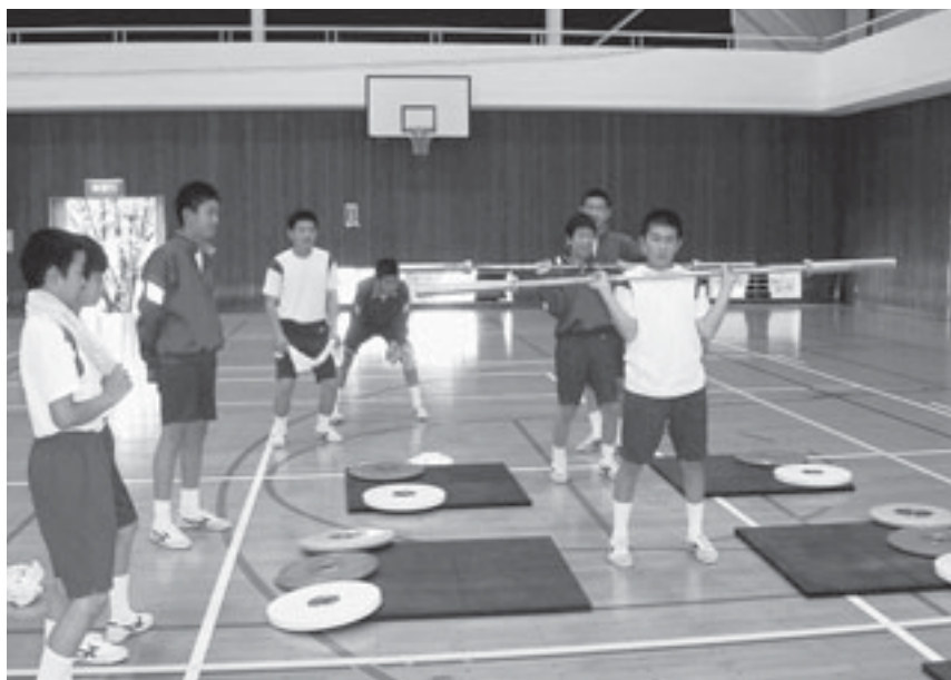
▲基礎練習に取り組む城崎中学校の生徒の皆さん

国体推進室では、ウエイトリフティング教室への小・中学生の参加者を随時募集しています。参加・見学を希望される方は国体推進室(☎0354)までお問い合わせください。