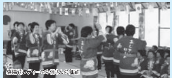
紫陽花レディースの皆さんの舞蹈