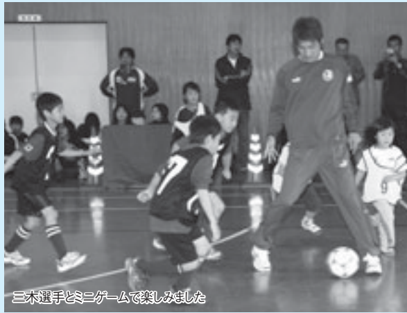
三木選手とミニゲームで楽しみました