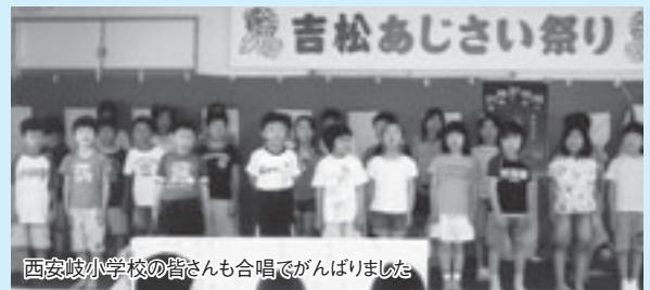
西安岐小学校の皆さんも合唱でがんばりました