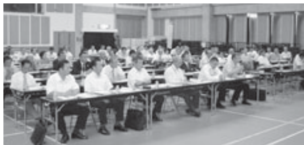
▲アグリホールで開催された国東市実行委員会設立総会・第1回総会

このあと大会開催基本方針や本年度の事業計画・予算案などが審議され、「チャレンジ! おおいた国体」の成功に向けて、市民の英知と情熱を結集し、簡素な中にも心のこもった国東市らしい国体の構築を図っていくことが確認されました。