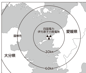
伊方原子力発電所までの距離

四国電力伊方原発3号機は国 の新基準に適合審査を経て許可 されたものであり、地元の伊方 町長、愛媛県知事の同意を得てい ます。九州電力川内原発において は、本市にも安全に対する説明に 来ています。したがって四国電力 には、近隣自治体に対する同意を してもらい、同時に安全性に対し 住民に説 明してほ しいと思 います。