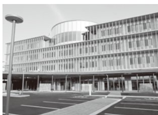
人口減少の課題解決に取り組む国東市

メガソーラー計画の断念は事実ですが、弾薬庫が出来るという事実は確認していません。