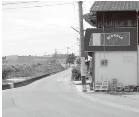
拡幅工事が待たれる市道小原鶴川線

現道の延長が90メートルであ るため認定基準に該当していな いが、奥に市所有の駐車場が隣接 しているため、この進入路を整備 することにより、道路延長100 メートル以上として今年度市道 編入を行ないます。