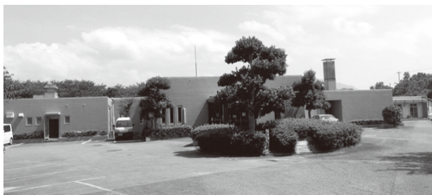
民営化が進む姫見苑

今回の財産処分に係る議案の提案は、優先候補者の社会福祉法人格取得後の平成28年10月末以降となります。