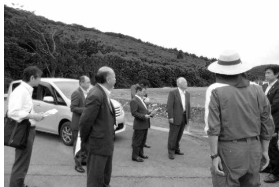
九設ふる里めぐみファーム現地視察

ました。九設ふる里めぐみファームはミニトマトとオリーブの栽培施設施工の準備をしいました。日出電機エコファームは、すでにリーフレタスの収穫が始まっています。い