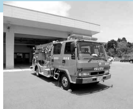
老朽化で買い替える化学消防ポンプ自動車

内閣総理大臣及び関係大臣に提出しました。その後発生した熊本地震により市民の不安も増大されているところから、伊方原発については今後も注目しながら継続審査することになりました。