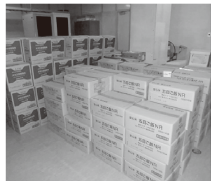
武蔵総合支所保管備蓄物資