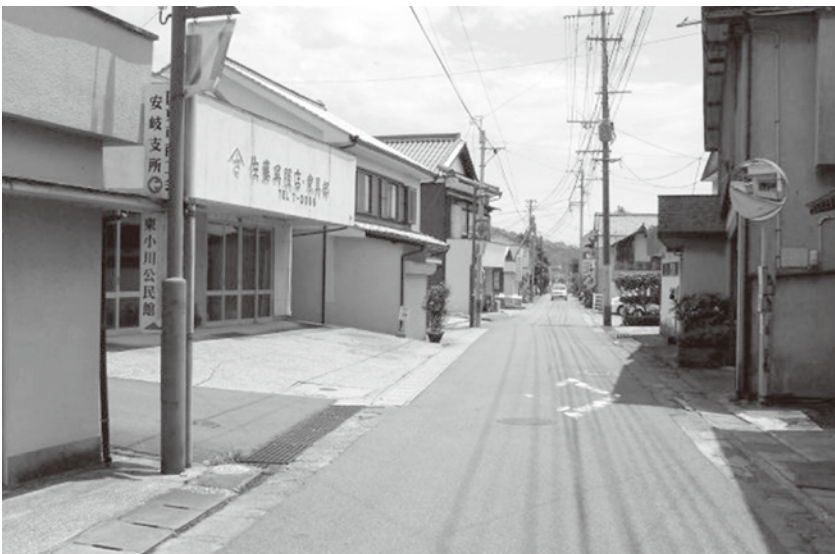
がんばる商店街総合支援事業で活性化を

もはじまっております。409万5千円の主なものは、文化財運搬手数料の300万円で文化的価値の高い貴重な文化財の運搬、設置、撤収作業に係る経費及び損害保険料です。その他に図録印刷として50万円を計上しています。