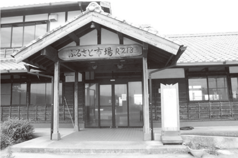
新たに指定管理されたR 213

A 平成26年度より分譲宅地の販売促進を目的にし契約が成立した場合、紹介者に対して報奨金10万円を支払