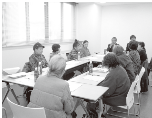
女性塾打ち合わせ会議

現在、男女共同参画計画と女性活躍のための推進計画を一体のものとして作成する予定です。