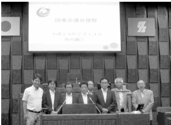
柏市議会の議場にて

また、行政視察後は、参加した全議員がそれぞれ報告文を作成し、視察の効果や意義を確認する作業を行っていたことは参考にするべき取組でした。