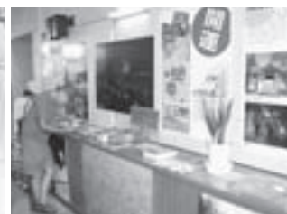
▲サイクリングターミナルロビーで行われた市観光パネル展