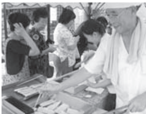
▲天ぶら・ちくわの実演販売

また、道の駅の特産品が当たる抽選会も行われ、オープン1時間後には賞品がなくなるほどの大盛況でした。